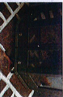
En insats i den öppna spisen ger mycket mer värme än om spisen skulle eldas som vanligt.